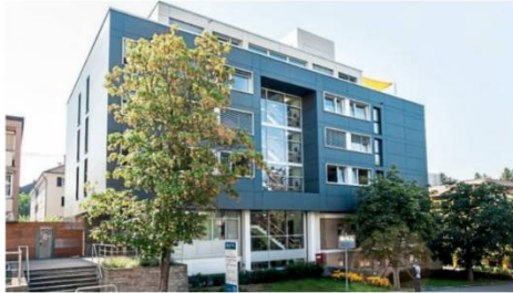
Sie liegt direkt gegenüber der RKH in Ludwigsburg.

Diese Seite wurde gestaltet von der Schule am Schlosspark in Ludwigsburg